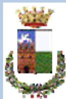
Comune di Rovigo